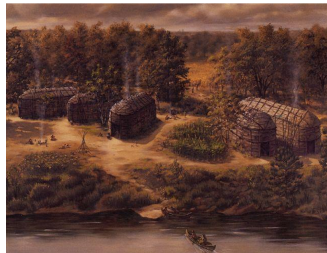
Illustration du site Mandeville, Guy Lapointe, 1988

Pour en savoir davantage sur l'activité « Randonnée nature et découvertes archéologiques... », visitez notre site internet ( www.biophare.com ) dans la section « Activités ».